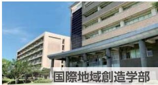
国際地域創造学部

本学部は、法学、政治学・国際関係学、哲学・教育学、心理学、社会学、琉球とアジアを中心とする歴史民俗学、文学、言語学など、人文社会学系の専門的・学際的な分野において真理を探究し、それを基に、個人の尊厳と基本的人権を尊重する平和・共生社会の形成者、社会全体の持続的発展に寄与する人材の育成を目指しています。