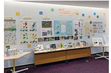
沖縄・奄美の世界自然遺産登録に関する企画展「環境報告書」も展示された。

また、所蔵する資料を様々な角度から紹介することで、図書館資料及び図書館を活用していただけるよう、主な利用者である学生を対象に企画展示をしています。さらに、沖縄関係の資料が充実していることも特徴で、学生・教職員だけでなく、県内外の多くの研究者にも利用されています。