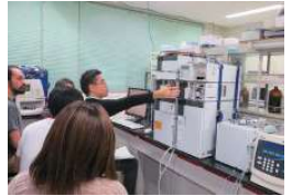
機器講習会の様子

研究基盤統括センターは令和4年度に改組し、研究基盤マネジメント部門、研究機器・技術支援部門、環境安全管理部門の3つの部門から構成される体制となりました。それぞれの部門では、全学的な研究基盤のマネジメントや研究機器・設備等の運用管理、教育研究に必要な各種研究技術・リソースの提供支援、化学物質・排水・廃棄物の運用・支援、ならびに沖縄県内並びに全国との研究基盤における連携協力等を行っています。また、研究基盤に関わる各種システム及び施設を管理運用しています。