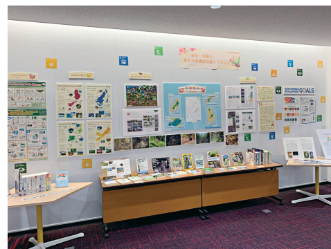
沖縄・奄美の世界自然遺産登録に関する企画展『環境報告書2020』も展示された。

また、所蔵する資料を様々な角度から紹介することで、図書館資料及び図書館を活用していただけるよう、主な利用者である学生を対象に企画展示をしています。さらに、沖縄関係の資料が充実していることも特徴で、学生・教職員だけではなく、県内外の多くの研究者にも利用されています。